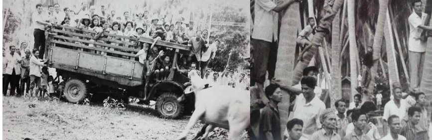
ภาพประกอบที่ 7 ลานชนควายและผู้ชมที่ยืนบนรถบรรทุก และป็นต้นมะพร้าวควายชน

ปัจจุบันมีการทำบ่อนควายชน นิยมเลือกสถานที่โดยใช้ดงมะพร้าวที่มีต้นมะพร้าวห่างห่างไม่ไกลจากชุมชนใหญ่เท่าใดนักโคนต้นมะพร้าวที่ให้ผลน้อยหรือไม่ให้ผลออก จัดหาไม้มาล้อมคอกวงกลม ๆ มีปีก 2 ข้างซ้ายขวาและเป็นทางเข้าออกเส้นทางวิ่งของความเมื่อเกิดการพ่ายแพ้ พื้นที่ของคอกประมาณ 500 – 600 ตารางเมตร ไม้ที่นำมาล้อมทั้งเสาและไม้รั้วต้องแข็งแรงโดยทั่วไปจะใช้ไม้มะพร้าวตัดเป็นท่อน ท่อนขนาดไม้ที่นำมาล้อมทั้งเสาและไม้รั้วต้องแข็งแรงยาวประมาณ 2.5 ถึง 3.0 เมตรมาทำเป็นเสาปักห่างกันประมาณ 1.5 ถึง 2.0 เมตร ใช้ไม้ไผ่ทั้งลำมาทำเป็นไม้รั้ว ใช้เชือกคาคออย่างแข็งแรงปีกสองข้างอันเป็นทางเข้าออกและทางหนีกว้างประมาณ 3 เมตรยาวประมาณ 30 ถึง 40 เมตรโดยใช้วัสดุแบบเดียวกันทำเป็นรั้วต่อจากวงกลมปากทางจดกับรั้วสนามชั้นนอกที่ตั้งขึ้นเพื่อบังตาคนที่ไม่ได้เสียเงินค่าดู สนามแต่ละสนามจะมีพื้นที่ว่างรอบ ๆ วงกลมประมาณ 3 – 4 เท่าของพื้นที่สำหรับควายชนใช้เป็นที่พักควายชนก่อนถึงวันชน และเป็นบริเวณที่ผู้ชมและผู้เกี่ยวข้องได้ใช้เป็นที่ยืนชม และดำเนินการในการชนควาย (พัฒนา, สัมภาษณ์วันที่ 25 ตุลาคม 2561)