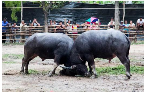
ภาพประกอบที่ 9 ควายชนในปัจจุบันจะชนกันในบ่อน

จากคำสัมภาษณ์ดังกล่าวสะท้อนให้เห็นว่า ถึงแม้จะมีเทคโนโลยี ความเจริญรุ่งเรือง การนำควายมาชนเป็นกีฬาประเพณีท้องถิ่น แต่ก็ยังมีความเชื่อ และมีพิธีกรรมแบบดั้งเดิมอยู่