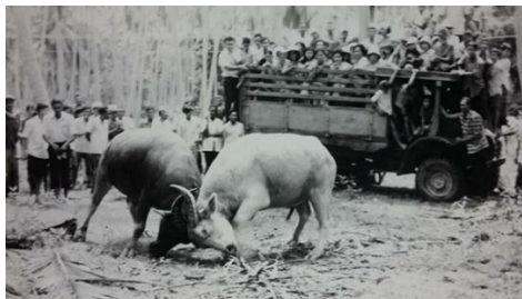
ภาพประกอบที่ 2 ควายเผือก “ขาวโรงสี” มีประวัติการชนชนะเลิศ (ตัวสีขาว)

ควายตัวที่หนึ่ง ควายขาวโรงสี มีลักษณะกลมคล้ายราชสีห์ ร่างงามกว่าควายใดเท่าที่นักเลงควาย ได้เห็นมา มีตาเล็ก หัวโหนก เขารูปคันช้อนสีขาว คอยาวมีขวัญ 7 ขวัญคือขวัญขนานบ หนอกหน้า หนอก หลัง ขนาดหูทั้ง 2 ข้าง และขวัญหน้าโพ ข้อเท้าสั้นเป็นข้อมะขาม ลักษณะนิสัยไม่ยอมต่อหัวกับควายสีอื่น จะชนเฉพาะปลายสีขาวเท่านั้น พยศ ไว้ตัวไม่ยอมให้คนขี่หลัง ค่อนข้างดุ ถ้าเจ้าของแสดงอาการโกรธจะ โกรธตอบ แต่ถ้าตีด้วยก็จะตีตอบ ไม่ยอมให้ไล่หลัง วิธีการเอาชนะคู่ต่อสู้ใช้วิธีสับยก จับตาคู่ต่อสู้แล้วยก ให้ล้ม มีน้ำใจนักกีฬาไม่ยอมทำร้ายเพื่อนเมื่อแพ้ เพียงแต่ไล่ใช้คางเกยท้าย ควายตัวนี้ได้เสียชีวิตไปแล้วเมื่อ ปีพ.ศ 2518 ที่มาของชื่อควายว่าขาวโรงสีคือ ควายถูกเลี้ยงอยู่แถวโรงสีข้าวของตาเลี้ยงใกล้ ๆ โรงไฟฟ้า แม่น้ำ หรือ ตรงข้ามตลาดสดแม่น้ำในปัจจุบัน จึงเป็นที่มาของควายขาวที่ชื่อ "ขาวโรงสี"